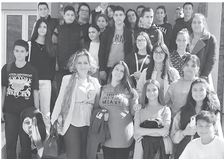
Završna prezentacija u Budvi

„Trudimo se da primjenjujemo: metode usmenog izlaganja, metodu rada na tekstu (medijskom sadržaju, novinskim člancima, sajtovima...), ilustrativno-demonstrativne (video, PTT...), debate, diskusije...“, navode nastavnici iz OŠ „Boško Buha“.