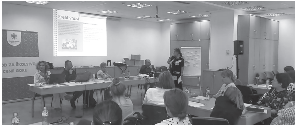
Sa obuke nastavnika