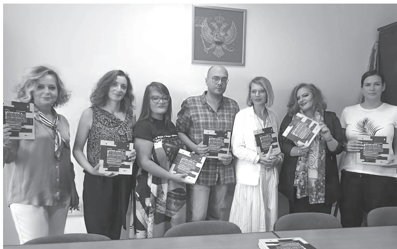
Priručnik za nastavnike

Nastavnici ocjenjuju da je broj časova dovoljan za