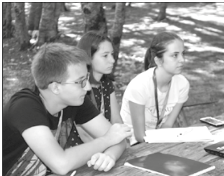
Časovi u prirodi

Ministarstvo nauke stipendira doktorska istraživanja