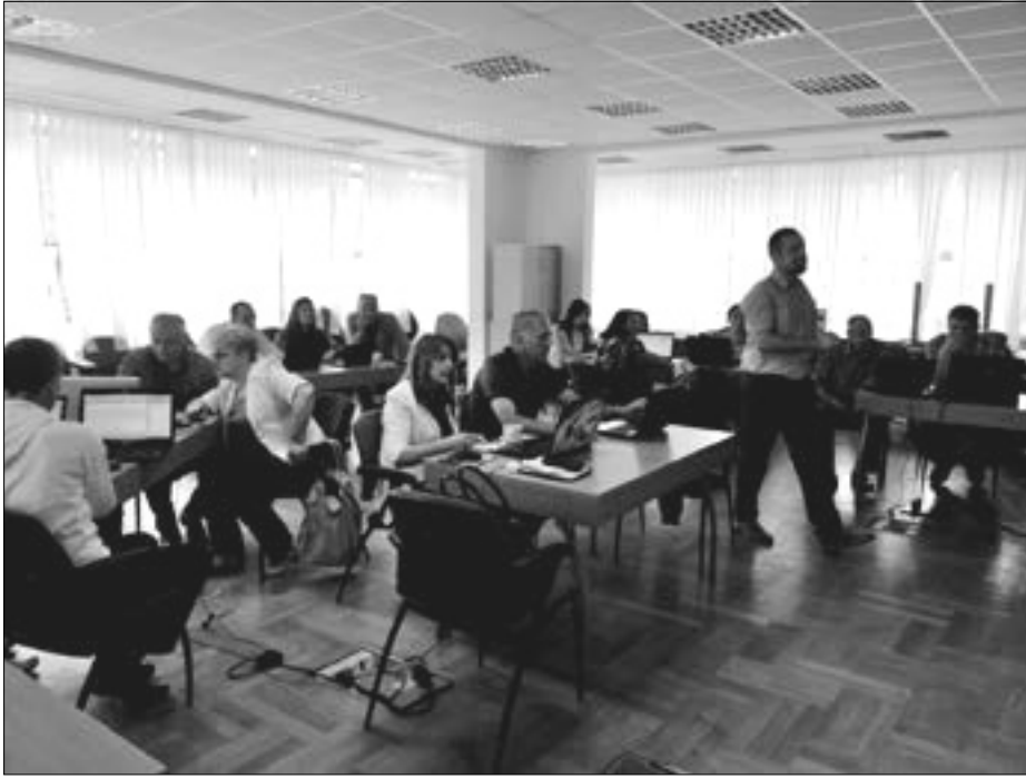
JAČANJE VASPITNE ULOGE ŠKOLE: Sa seminar

Model PRNŠ/V je zaista važan dio sistema profesionalnog razvoja nastavnika. Nastao je u okviru Projekta reforme obrazovanja u Crnoj Gori kroz komponentu Razvoj sistema profesionalnog razvoja nastavnika (2005–2009). Istraživanja i analize koje je realizovao Odsjek za KPR pokazuju da je ovaj model u vaspitno-obrazovnim ustanovama veoma prihvaćen, što nam je dalo podstrek za njegovo dalje unapređivanje i razvijanje. Profesionalni razvoj nastavnika u velikoj mjeri zavisi od prepoznavanja važnosti ovog segmenta za razvoj obrazovno-vaspitne ustanove od strane njene uprave, i, u skladu sa tim, podrške koja se u tom procesu pruža nastavnicima. Uloga rukovodioca ustanove u donošenju odluka i pružanju podrške nastavnicima u tom procesu je od suštinskog značaja. Rukovodilac treba da razumije zašto su kontinuirani profesionalni razvoj i svi njegovi segmenti važni za razvoj kvaliteta rada nastavnika, i obrazovno-vaspitne ustanove uopšte, te da u potpunosti bude uključen u taj proces. Iz tog razloga, uz podršku Britanskog savjeta, autorski tim sastavljen od predstavnika Zavoda za školstvo i Centra za stručno obrazovanje izradio je ove godine „Priručnik za direktore u ovdjenu kontinuiranog profesionalnog razvoja nastavnika u školi/usta-