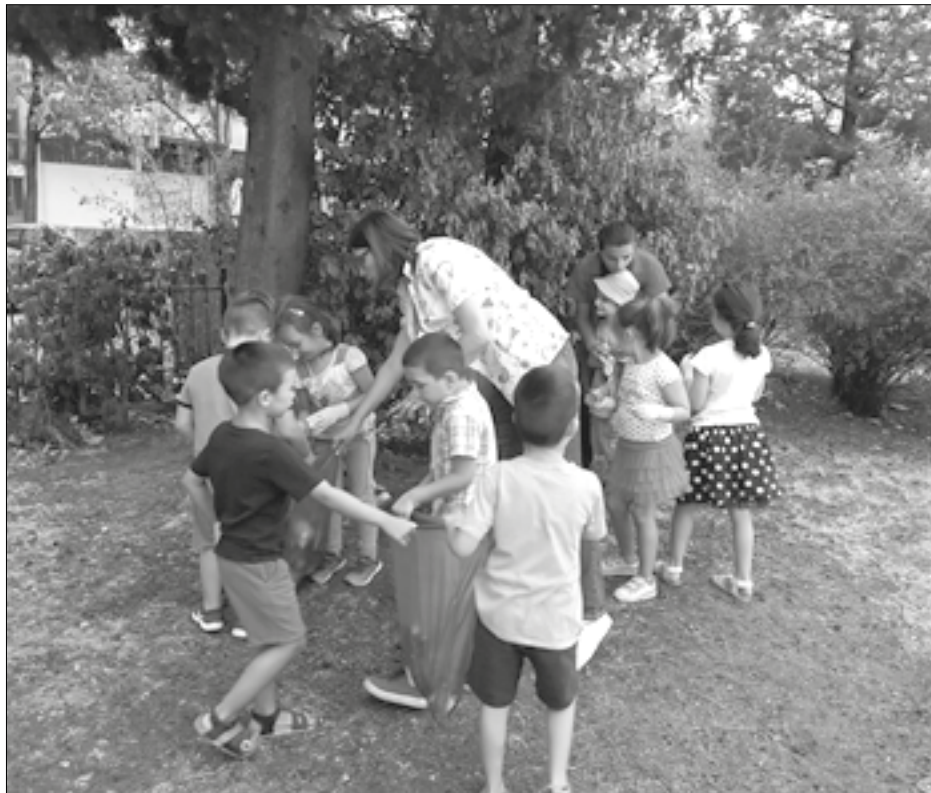
Podrška Ministarstva prosvjete

U okviru projekta „Let’s do it, Montenegro“, koju realizuje NVO „ADP-Zid“, pod sloganom „Nastavljamo drugačije“, u podgoričkoj Javnoj predškolskoj ustanovi „Dina Vrbica“ organizovana je akcija čišćenja dvorišta vaspitnih jedinica, u kojoj su učestvovala djeca starijih vaspitnih grupa i zaposleni.