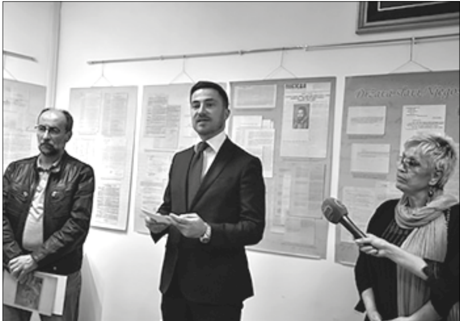
Najupečatljiviji književni odraz stvarnosti