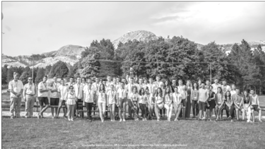
Mladi istraživači na okupu

Roganović objašnjava da su polaznici svakog dana imali 4–5 predavanja i dva puta po dva sata praktikuma. Na praktikumima su se obrađivale usko naučne teme iz oblasti za koju su se prijavili (matematika, fizika, hemija, biologija, astronomija, elektronika i medicina), a sa polaznicima u naučne vode su uronili asistenti. Prvi put ove godine organizovan