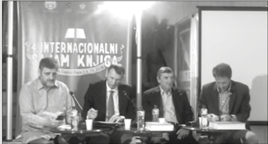
Prva je leksikografska sinteza crnogorske prosvjete

U njemu su se našli ljudi koji su svojim rezultatima izdvojeni u svom profesionalnom okruženju i koji su dugodišnjim radom i pregalaštvom afirmisali vrijednosti obrazovanja. Tako će se, zahvaljujućiom leksikonu, trajno zabilježiti ljudski potencijal u sistemu crnogorske prosvjete od osnivanja prvih škola do školske 2016/2017. godine