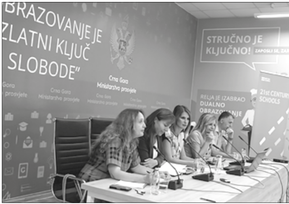
Zahvalnost Britanskom savjetu