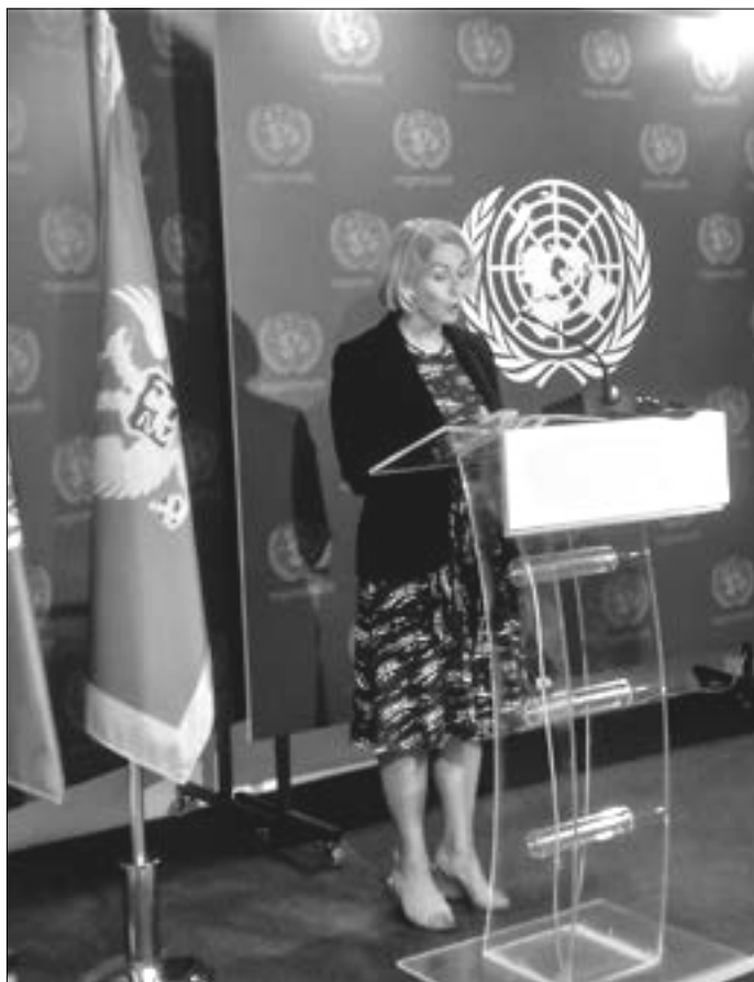
Zelene škole imaju veliki uticaj na ekološku kulturu učenika