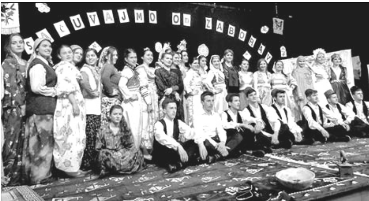
Vratiti posjetioce u vrijeme njihovih predaka