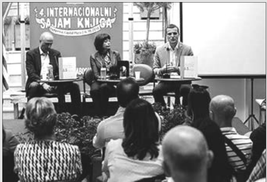
Dopunjeno izdanje nakon deset godina dokaz važnosti knjige

Knjiga „Istorija Crne Gore u 65 priča” može se naći u Zavodovim knjižarama u Podgorici, Baru i Bijelom Polju. N. N.