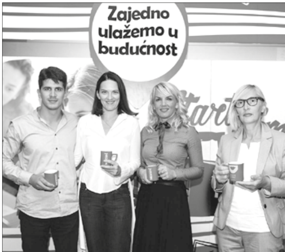
Za brži i efikasniji pristup bibliotečkoj građi

Prema prošlogodišnjem istraživanju kompanije Nestlé, sprovedenom u regionu, čak 94 odsto mladih je aktivno na društvenim mrežama ili koriste aplikacije za komunikaciju. Facebook je najčešći sa 93 odsto, zatim Viber (71%), Instagram (61%), WhatsApp (58%) i Twitter (17%)