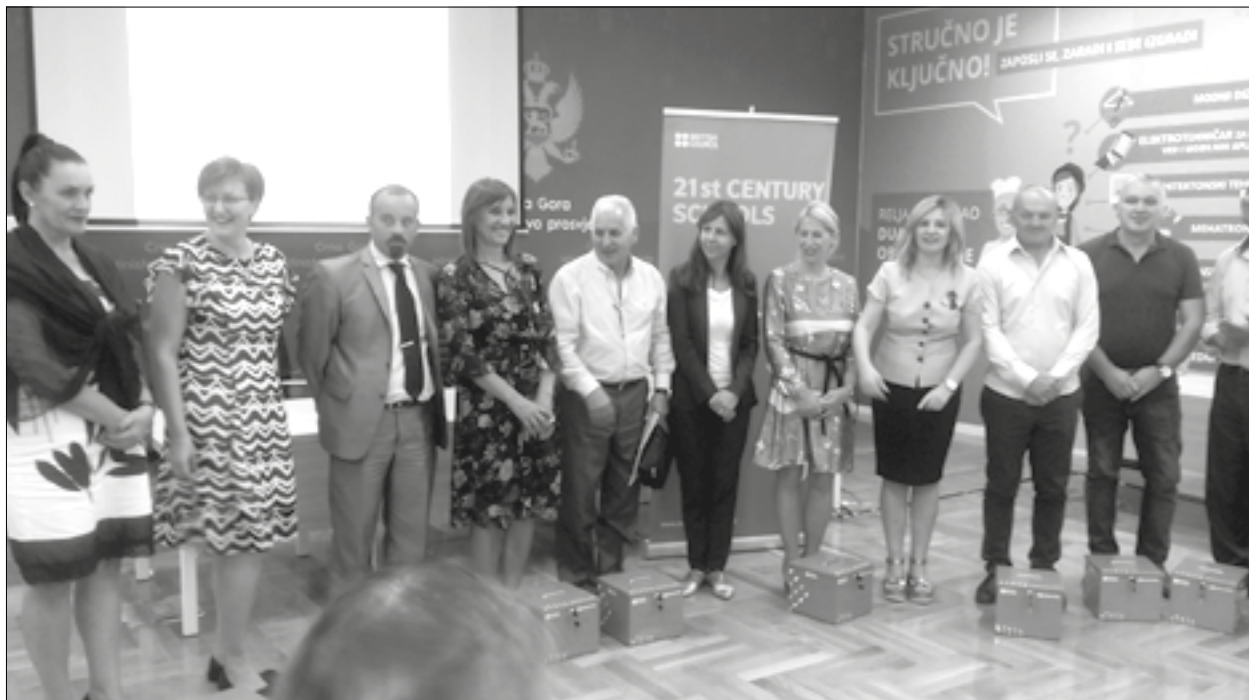
Formiranje vještina za ekonomiju 21. vijeka

Počela druga faza projekta „Škole za 21. vijek“