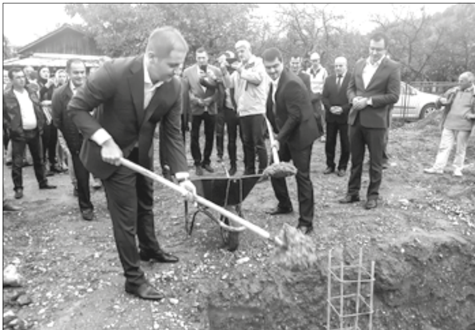
Sva djeca treba da imaju iste uslove

Ministar prosvjete dr Damir Šehović postavio je kamen temeljac za izgradnju nove škole u Vojnom selu u Plavu. Riječ je o područnoj jedinici OŠ „Hajro Šahmanović“ koju će pohađati djeca koja žive na ovom području i gdje će imati priliku da borave u pristojnom i sigurnom ambijentu.