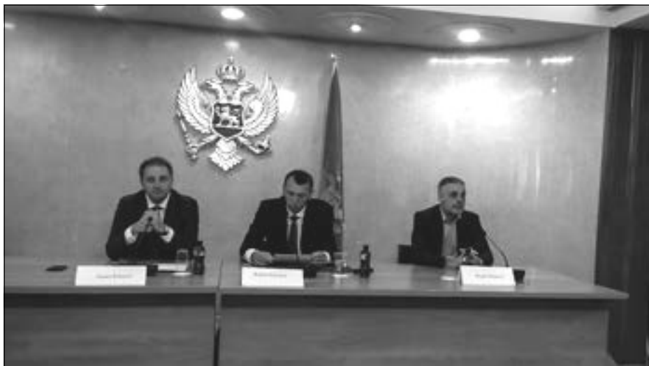
TREBA DA BUDEMO SPREMNI ZA NOVINE: Sa sjednice Odbora za prosvjetu, nauku, kulturu i sport Skupštine Crne Gore

Ministar je apostrofirao nekoliko uslova koji su neophod-