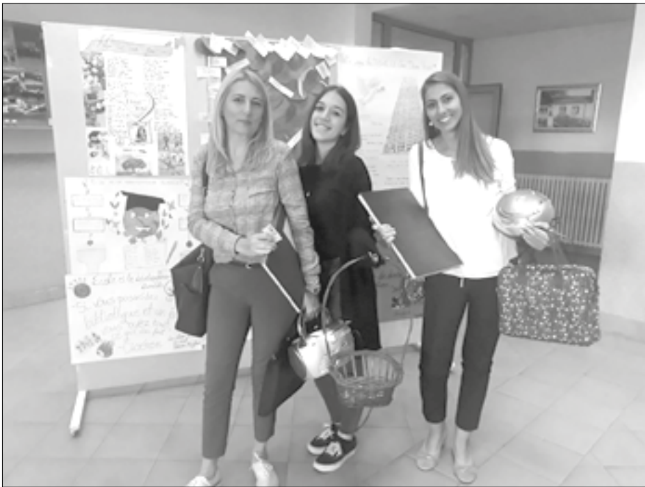
Širenje saznanja o različitim kulturama

„Cilj ovih aktivnosti je podsticanje učenja stranih jezika, uvažavanje i tolerancija, prihvatanje kulturoloških razlika i nasljeđa kao prednosti u procesu odrastanja i obrazovanja, razumijevanje izreka i mudrosti umnih ljudi i slanje poruka mira, ljubavi i uzajamnog uvažavanja“