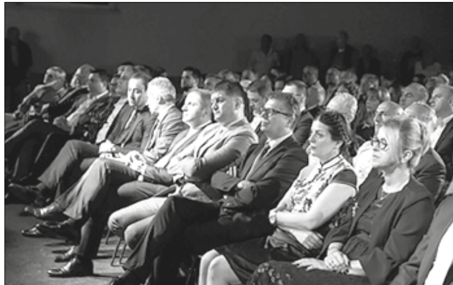
Sa centralne proslave

U večernjim satima organizovana je centralna proslava kojoj su prisustvovali brojni gosti iz javnog, političkog i kulturnog života Crne Gore, veliki broj iseljenika i lokalnog stanovništva