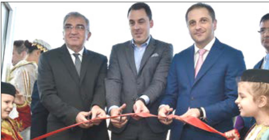
Mjesto u vrtiću za svako dijete

Vaspitna jedinica otvorena u rekonstruisanom objektu koji je Glavni grad ustupio na korišćenje, u čiju je rekonstrukciju uloženo oko 70.000 eura kako bi objekat bio po zadovoljavajućim standardima i za čije opremanje je TIKa (Turska agencija za međunarodnu saradnju i koordinaciju) obezbijedila oko 20.000 eura