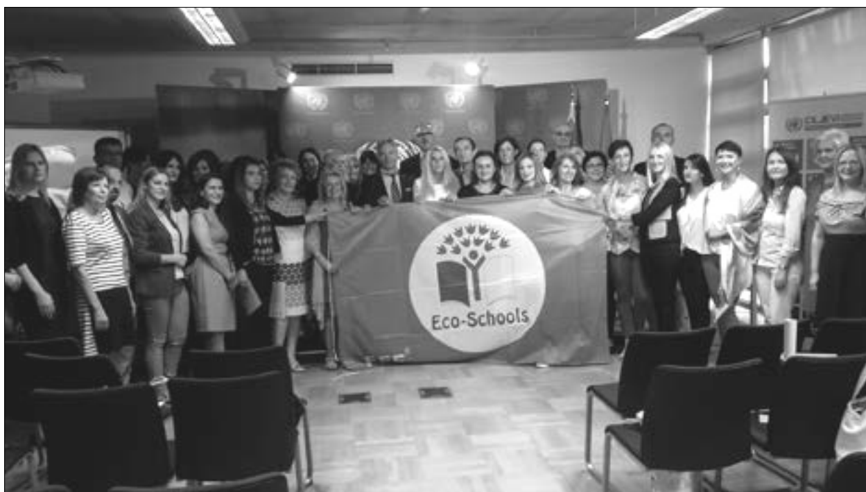
Nagrada – potvrda uspješne realizacije programa