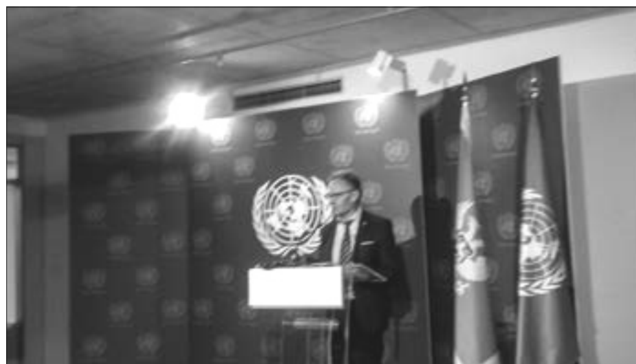
Implementacija održivog razvoja jedan od ciljeva Zavoda za školstvo

„Efekti klimatskih promjena već su vidljivi. Porast emisije ugljen-dioksida dovodi do globalnog zagrijavanja. Uobičajeni su požari i poplave koje dovode u opasnost živote širom svijeta. Za očekivati je da dođe i do porasta nivoa mora. Prognoze nijesu optimistične i Crna Gora nije izuzetak u tom pogledu. Očekuje sa da u ovoj zem-