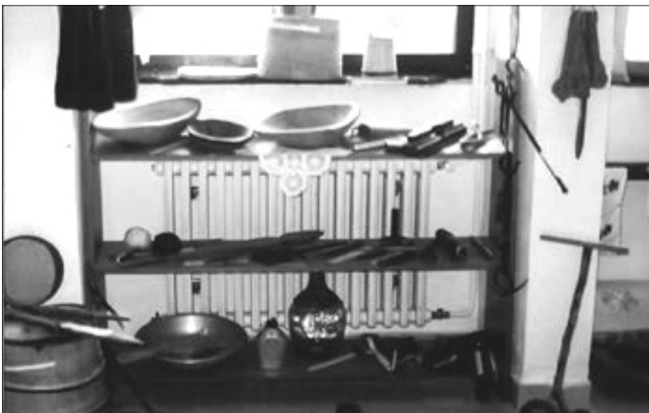
Etnološki muzej u školi