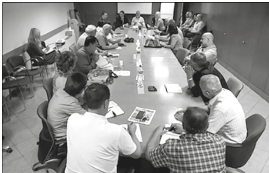
Obuka za direktore

Od ukupnog broja učenika upisanih u prvi razred, u četvorogodišnje stručne škole upisano oko 51 odsto, u trogodišnje oko 20, a u gimnazije oko 29 odsto đaka. Više modularizovanih obrazovnih programa. Prošle školske godine urađeno 10, a od ove realizuje se još 16 novih