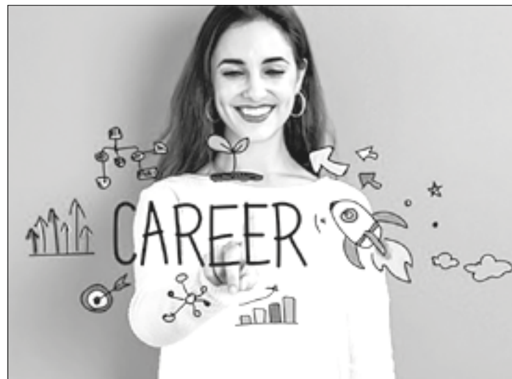
Ojačati naučne i inovativne kapacitete