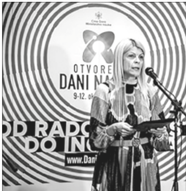
Dr. Sanja Damjanović, ministarka nauka

regiona realizuje Britanski savjet, nastavnici osnovnih škola obučavaju se da u svom radu promoviraju i podstiču razvoj digitalnih vještina, kritičko razmišljanje i rješavanje problema, kao i digitalnu pismenost. Micro: bit je održan takođe u Budvi i u Bijelom Polju.