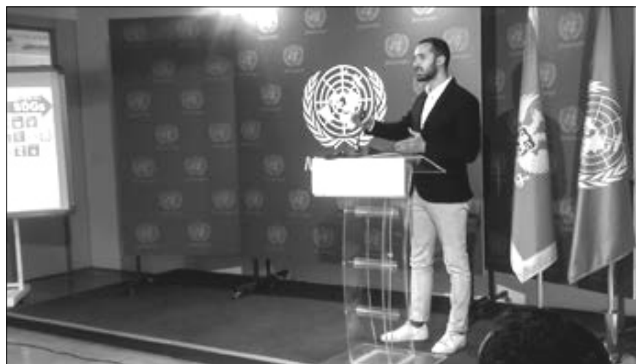
Mladi moraju biti svjesni klimatskih promjena

lji klima u budućnosti bude toplija i suvlja tokom ljeta. Očigledno je da klimatske promjene predstavljaju ključni rizik kad su u pitanju poljoprivreda, zdravstvo, snabdijevanje, proizvodnja, ishrana, energetska bezbjednost“, rekla je Mekluni i ukazala da je veoma je važno ulaganje u obrazovanje mladih ljudi koji će biti svjesni klimatskih promjena ali i spremni da „rješavaju ovaj najveći izazov u ljudskoj istoriji“, kao i da će zelene škole imati veliki uticaj na ekološku kulturu učenika, na njihove stavove i način razmišljanja. U tom cilju važno je da sve škole postanu eko-škole.