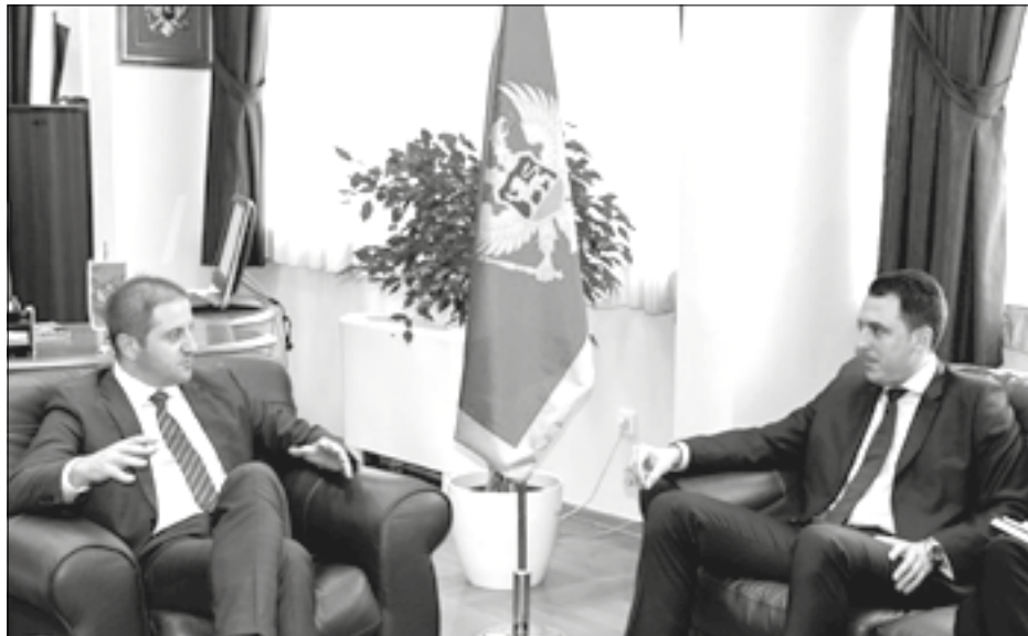
Radiće se i na oplemenjivanju školskih dvorišta

Vuković je rekao da je Glavni grad spreman da zajedno sa Ministarstvom prosvjete radi na iznalaženju lokacija koje bi bile ustupljene za izgradnju novih vrtića ili već postojećih objekata koji bi eventualno bili ustupljeni na adaptaciju i rekonstrukciju