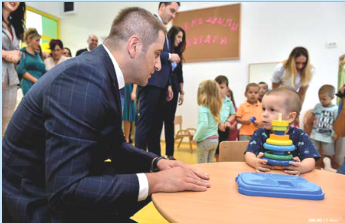
Ministar prosvjete dr Damir Šehović u vrtiću „Dragan Radulović“