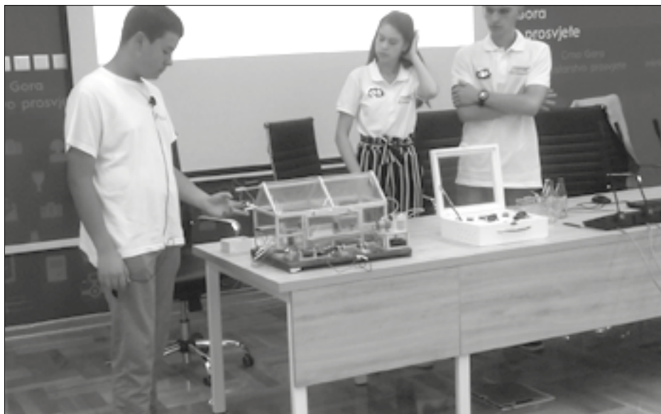
Povećana motivisanost učenika