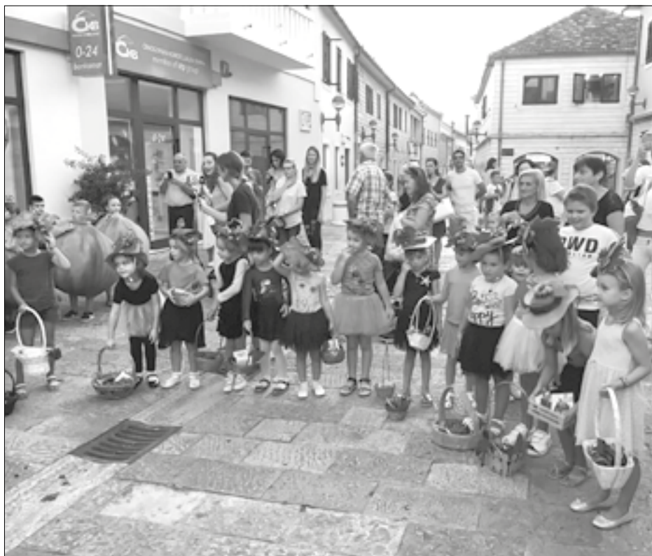
IZMAMILI BROJNE OSMIJEHE: Mališani iz vrtića

Mališani iz Vaspitne jedinice Savina, koja pripada hercegnovskoj Javnoj predškolskoj ustanovi „Naša radost“, učestvovali su u zanimljivoj manifestaciji pod nazivom