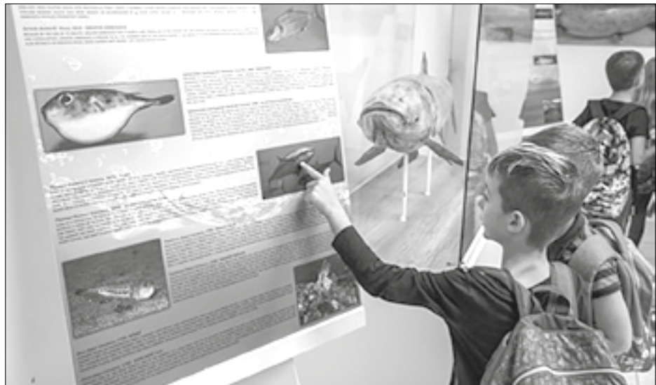
Izložba u Prirodnjačkom muzeju