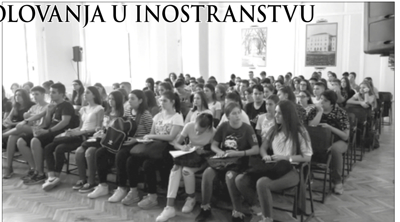
Veliki odziv gimnazijalaca

„Zainteresovani učenici razgovarali su s Šćepović o svim temama značajnim za ovu razmjenu, kao što su načini podnošenja molbe, konkurisanja za stipendiju, uslovi boravka i školovanja u SAD, kao i uopšte o sistemu američkog obrazovanja i života u Americi“, dodaju iz ove škole. N. N.