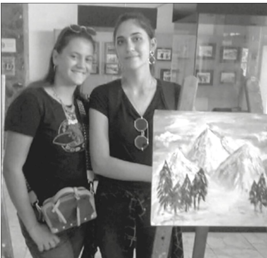
Zahvalnost matičnoj opštini

Nedavno su dvije učenice tivatske Srednje mješovite škole „Mladost“ predstavile ovaj bokokotorski grad na likovnoj koloniji u Skoplju.