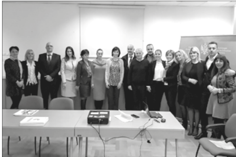
Promocija završnih radova direktora

ljeva). Ovo su osnovni zahtjevi koji su postavljeni pred komisije koje su radile na programima. U sastavu komisija su bili predstavnici Zavoda za školstvo (izuzev za predmetne programe: Fizičko vaspitanje, Njemački jezik i Sociologija), Univerziteta Crne Gore i nastavnici praktičari. Koliko su ciljevi ostvareni, teško je procijeniti u ovom trenutku. Potrebno je da prođe nekoliko godina njihove implementacije, pa da tek sa većom sigurnošću možemo govoriti o