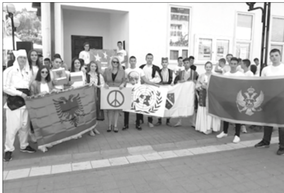
Sticanje i proširivanje kompetencija