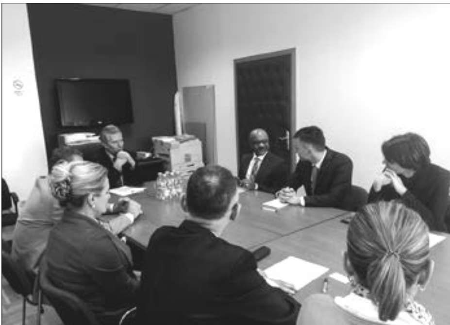
Dobra saradnja sa UNICEF-om