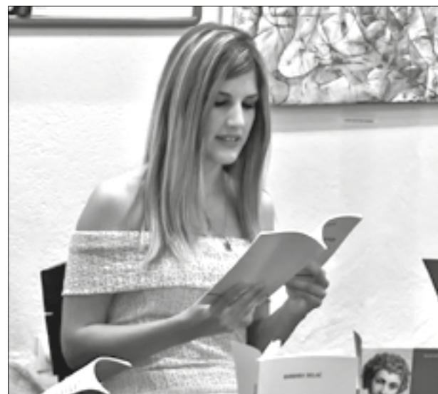
Pitanja koja nas se svih tiču

„U vremenu u kome se pjesništvo po pravilu delegira u privatnost i uspostavlja