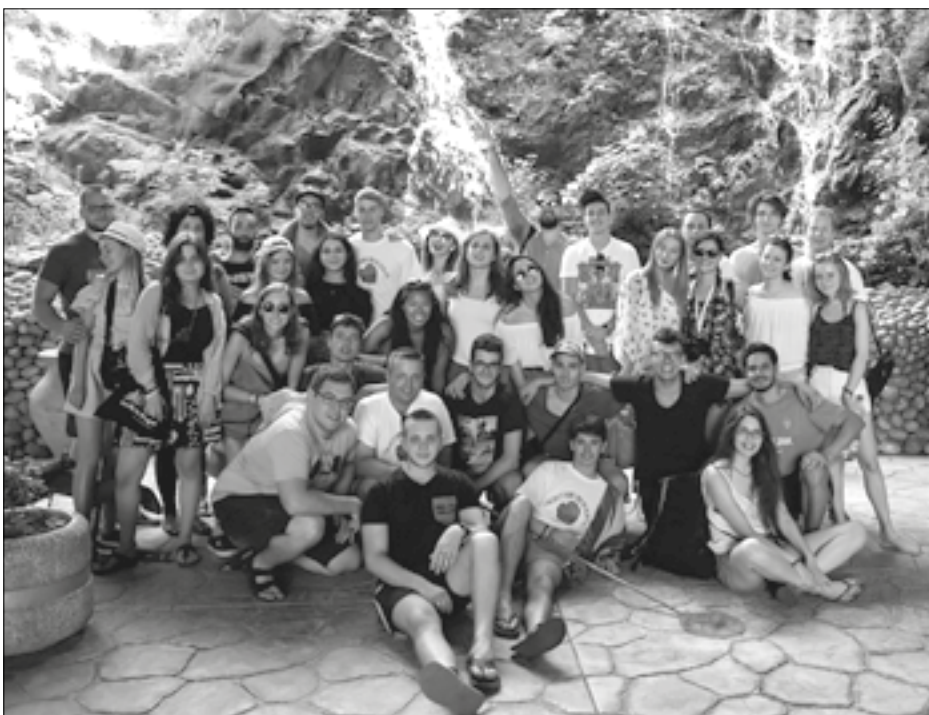
STEKLI PRAKTIČNA SAZNAVANJA: Polaznici kursa

Predavači bili stručnjaci iz svijeta ekonomije i finansija, a polaznici posjetili i nacionalne parkove Skadarsko jezero i Lovćen, Njegošev mauzolej i Bokotorski zaliv