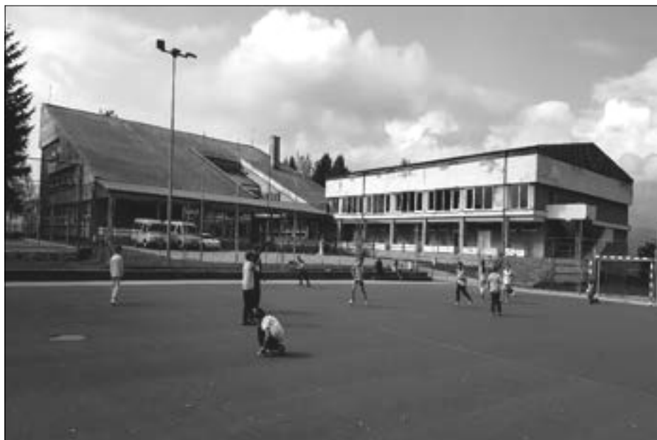
Zgrada matične škole

Škola ima savremene uslove za rad koji omogućavaju učenicima lakše usvajanje nastavnih sadržaja.