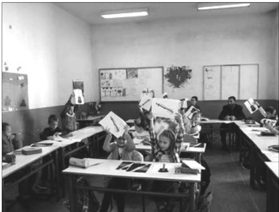
U skladu sa razvojnim i obrazovnim potrebama

„Dobra organizacija, spremnost nastavnika da nove paradigme uključe u svoj rad, preporuka su za nagradu ovoj školi. Podrška talentovanim učenicima, dobro organizovane vannastavne aktivnosti, saradnja sa lokalnom zajednicom i roditeljima ukazuju na otvorenost ove škole ali i usvajanje savremenog pristupa u organizaciji. Škola učestvuje u brojnim projektima a njeni učenici su se pokazali kao uspješni na mnogim takmičenjima. Visok profesionalizam, spremnost za saradnju, otvorenost za nove izazove donose ovoj školi nagradu kao podsticaj da tim putem nastave“, kazala je predsjednica žirija za dodjelu Državne nagrade „Oktoih“ Zoja Bojanić-Lalović , obrazlažući odluku.