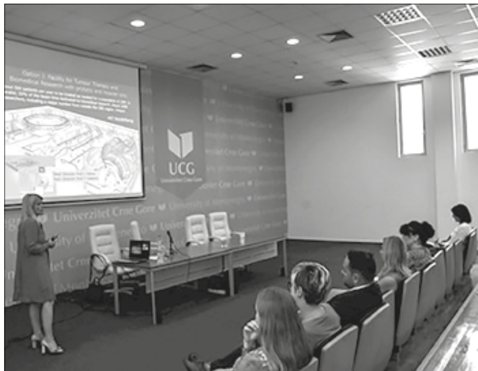
Na skupu ocijenjeno da naučnici iz Zapadnog Balkana posjeduju znanje i potencijal

Naučnoistraživačka zajednica mora da osluškuje potrebe industrije i ponudi adekvatna rješenja, jer njena misija u današnjem svijetu mora biti, prije svega, jačanje industrijskog i ekonomskog potencijala jedne zemlje, a kada su u pitanju inovacije, treba voditi računa o održivosti i uticaju proizvoda na društvo, ocijenjeno je na skupu