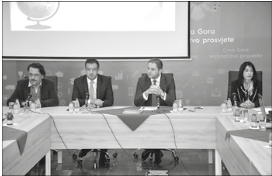
Usmjeravanje društva na svoj najbolji dio

Najboljim učenicima i nastavnicima biće dodijeljeno oko pola miliona eura. Predviđeno 200 nagrada za nastavnike, 200 za učenike i 70 nagrada koje po automatizmu dobijaju osvajači jednog od prva tri mjesta na priznatim državnim i međunarodnim takmičenjima (u organizaciji i koordinaciji Ispitnog centra Crne Gore)