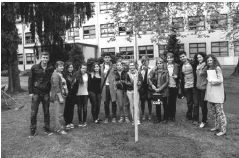
Uzvratna posjeta Gimnaziji u Varaždinu